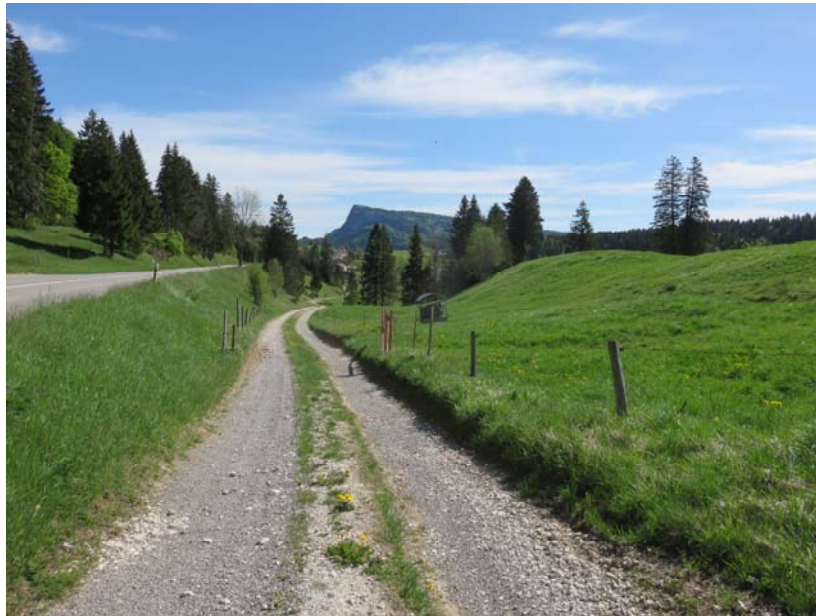
Au Passioux sous les Essertex, c'est par ici. Sus-jacente, la route cantonale actuelle.

Les Essertets, ici plutôt selon le folio 35 vu plus haut, furent l'endroit où l'on procéda à la fonte des cloches des trois villages en 1780 : Le Lieu, Les Charbonnières et le Séchey. Cet épisode a été narré avec beaucoup de précision par le même auteur que dessus. Nous reproduisons en annexe cette étude.