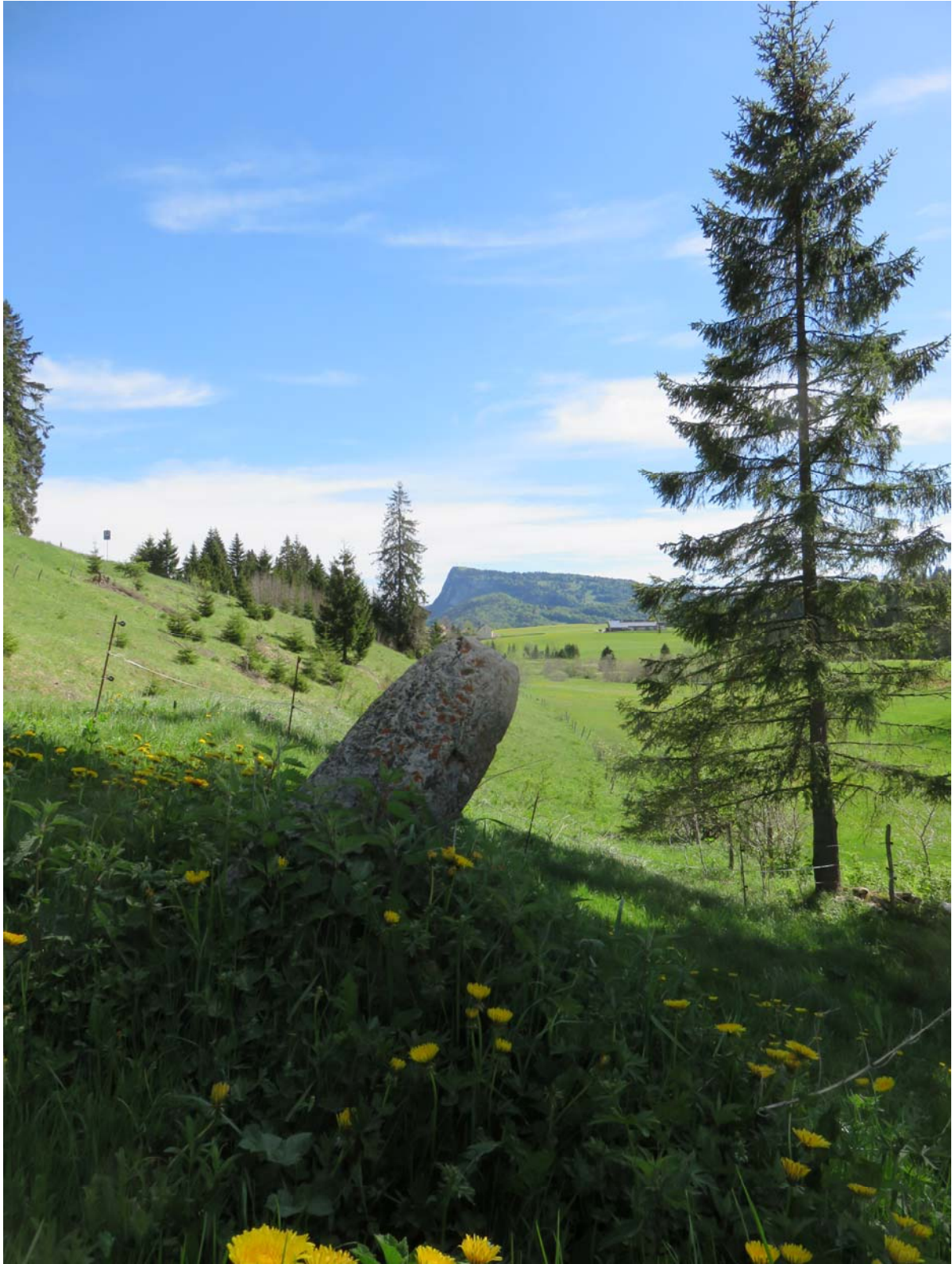
La dernière borne encore intacte du vieux chemin des Essertex.